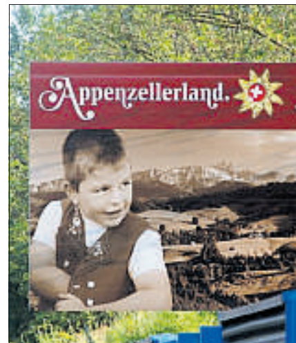
Hinweisschild in der Ostschweiz.

Diese Situation will der Bund nun mit neuen, verschärften Weisungen ändern. Deren Ziel besteht darin, die touristische Signalisation punkto Sicherheit und Erscheinungsbild zu verbessern und den Schilderwald «auf ein Minimum zu begrenzen», wie es im Bericht des Amtes heisst. Betroffen von den Vorschlägen sind zum einen die «Ankündigungstafeln», die vor Ausfahrten auf ein bestimmtes touristisches Ziel hinweisen. Von ihnen darf pro Ausfahrt in der Regel nur noch eine aufgestellt werden, was ihre Zahl auf landesweit 440 beschränkt. Zudem müssen die Tafeln am rechten Fahrbahnrand stehen, und zwar so, dass sie die ordentliche Signalisation nicht beeinträchtigen. Das beworbene Ziel schliesslich darf nicht weiter als 20 Kilometer von der Ausfahrt entfernt sein.