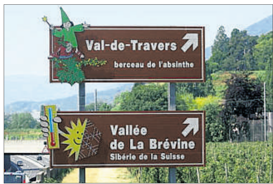
Werbung für Schnaps und den Kältepol der Schweiz im Neuenburger Jura.

Ob dies ausreicht, um die Kantone für das Vorhaben zu gewinnen, ist offen. Sie können sich nun in einer Anhörung zum Projekt äussern, ebenso wie die wohl eher skeptischen Tourismusverbände.