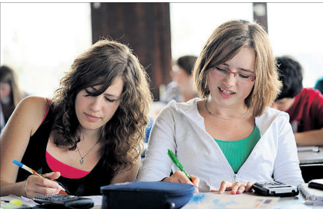
Finanzielle Allgemeinbildung bildet einen neuen Schwerpunkt im Lehrplan 21. Schülerinnen beim Lösen von Rechenaufgaben.